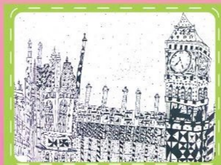
線畫/602廖宇綸 倫敦的大笨鐘