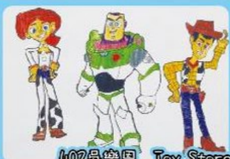
402吳樂恩 Toy Store 玩具總動員人物