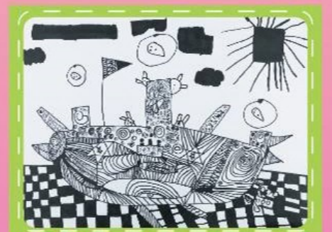
線畫/603朱冠文 迷失的小船 鳳凰號