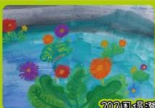
202周品澄 清晨的非洲菊