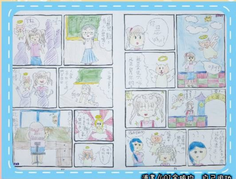
漫畫/401余婉均 自己用功