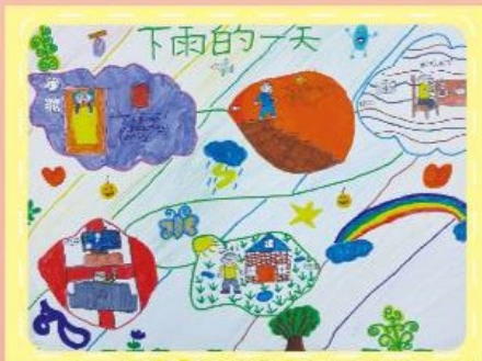
漫畫/402張凱琪 下雨的一天