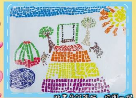
貼畫/401張婉 校園一隅