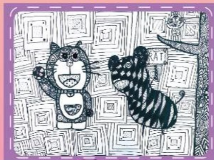
線畫/602李書瑤 世紀之戰